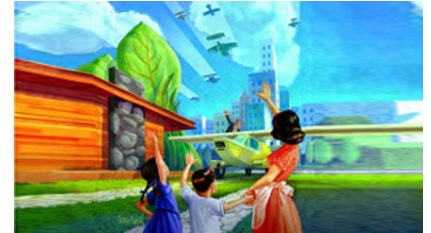
Caso práctico: la creación del Patent Troll (secuestrador de patentes) por el artista Bob MacNeil. (Fotografía: Bob MacNeil)

Versiones en otros idiomas: No todas las páginas están disponibles en todos los idiomas. Si una página no está disponible en el idioma de su elección, se abrirá la página en inglés.