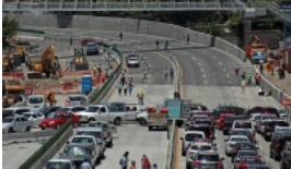
SCT abre cuarto carril en el Paso Express