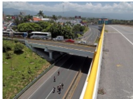
Mal estado de autopistas por factores externos: SCT