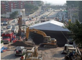
Vehículos de carga aún no circulan por el Paso Express