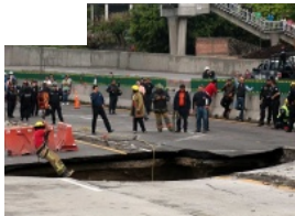
En 15 días estará listo el informe de peritaje en el Paso Express