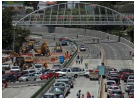
CNDH pide medidas cautelares por Paso Express